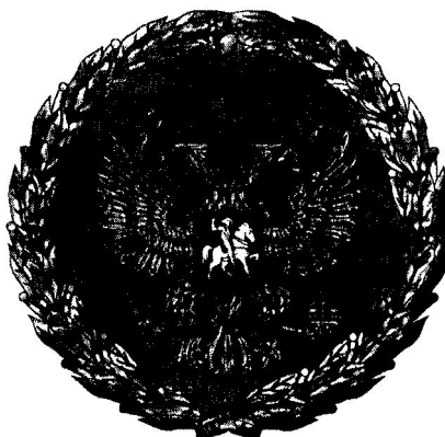
РИСУНОК НАГРУДНОГО ЗНАКА К ПОЧЕТНОЙ ГРАМОТЕ ПРЕЗИДЕНТА РОССИЙСКОЙ ФЕДЕРАЦИИ

Утвержден Указом Президента Российской Федерации от 11 апреля 2008 г. N 487